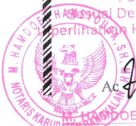
Foto Copy ini HAK ASASI MANUSIA REPUBLIK INDONESIA perlihatkan Kepada Saya, NOTARIS

A.n. MENTERI HUKUM DAN HAK ASASI MANUSIA REPUBLIK INDONESIA DIREKTUR JENDERAL ADMINISTRASI HUKUM UMUM